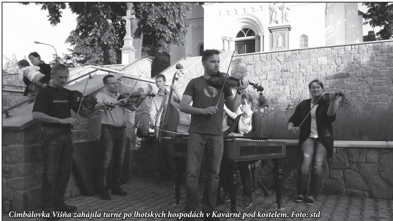
Cimbálovka Višňa zahájila turné po lhotských hospodách v Kavárně pod kostelem.

Na všech místech se začíná v 17 hodin, předpokládaný konec je ve 21 hodin. std