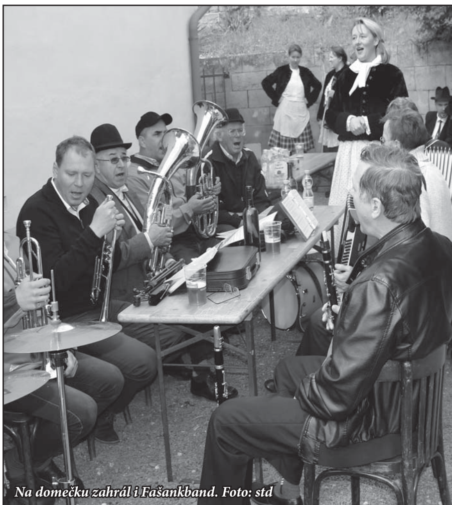
Na domečku zahrál i Fašankband.