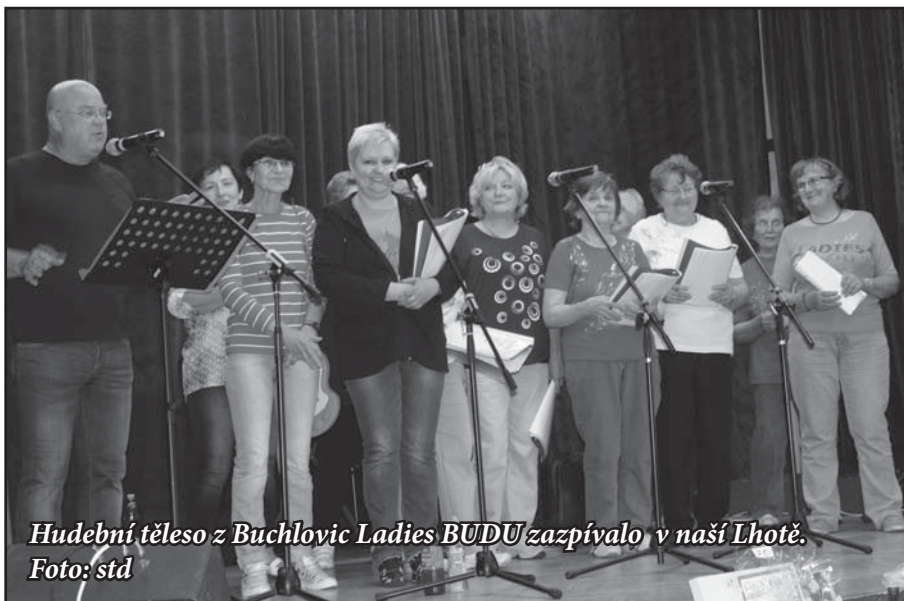
Hudební těleso z Buchlovic Ladies BUDU zazpívalo v naší Lhotě.