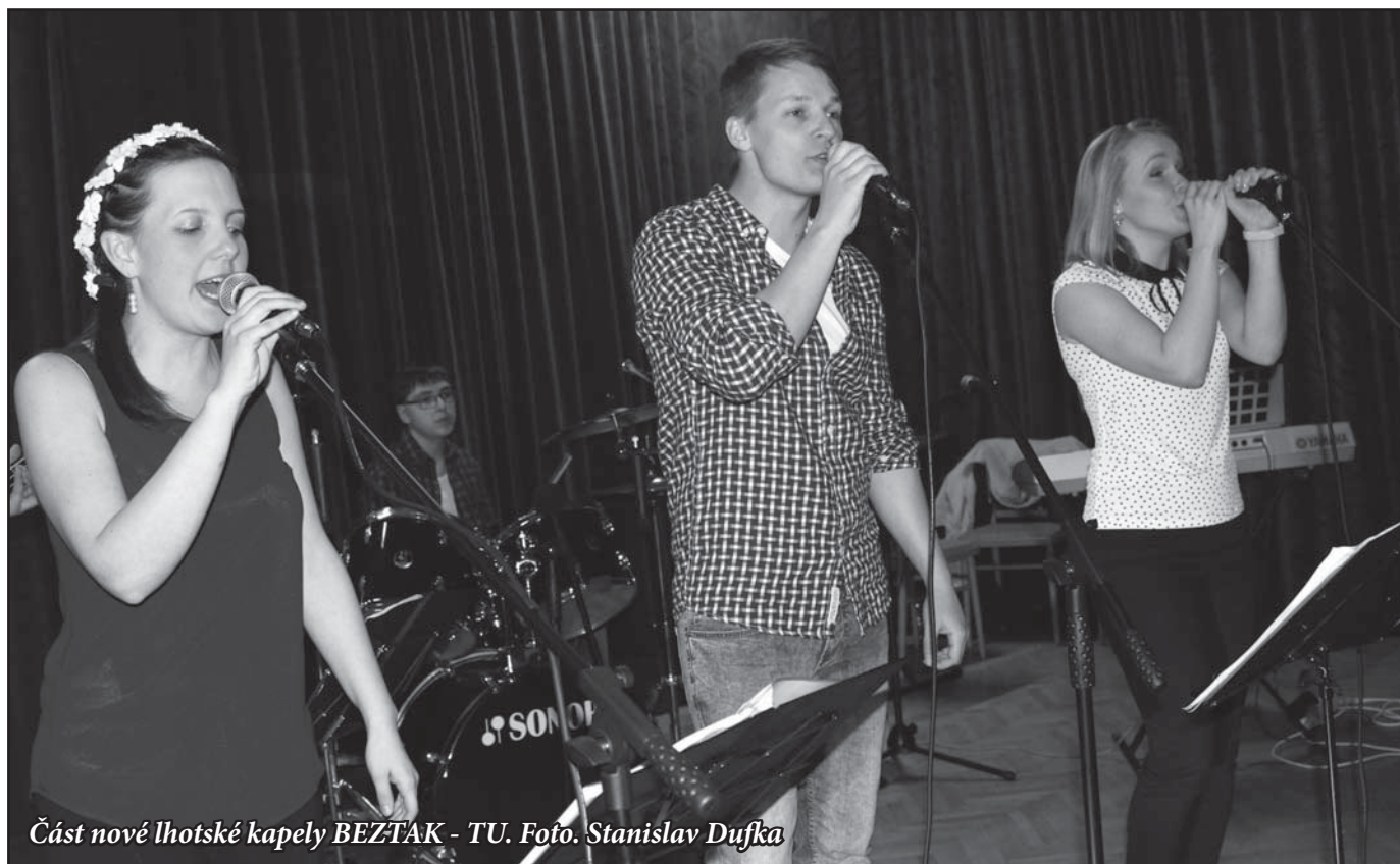
Část nové lhotské kapely BEZTAK - TU.