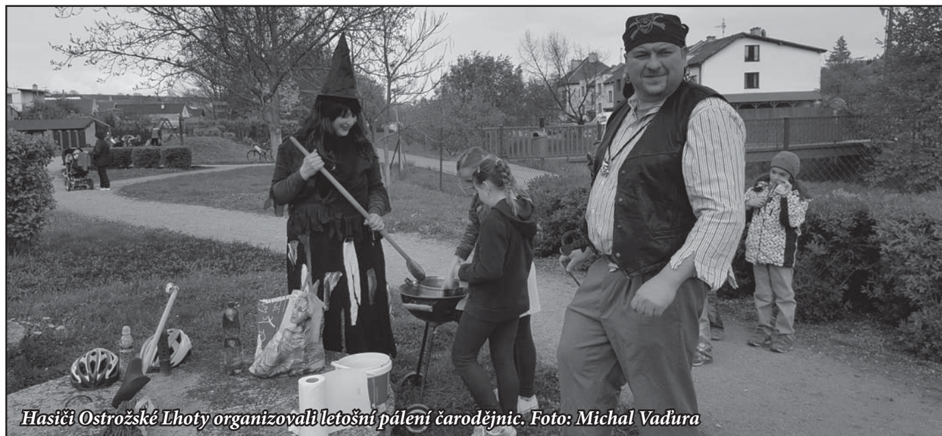
Hasiči Ostrožské Lhoty organizovali letošní pálení čarodějnic.