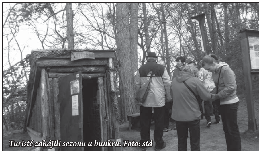
Turisté zahájili sezonu u bunkru.

Přesně rok po otevření se lhotští turisté rozhodli, že u bunkru otevřenou