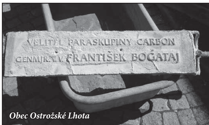
Obec Ostrožské Lhoty