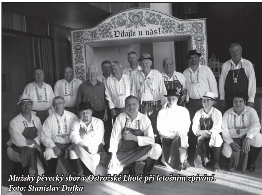
Mužský pěvecký sbor v Ostrožské Lhotě při letošním zpívání.