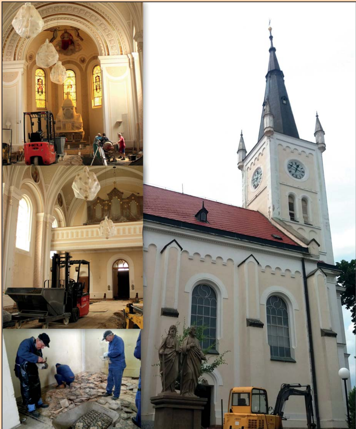
Rekonstrukce kostela svatého Jakuba v Ostrožské Lhotě Koláž: Stanislav Dufka