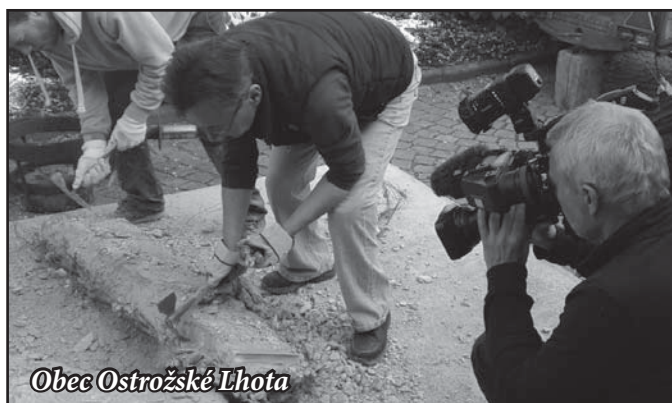
Obec Ostrožské Lhoty