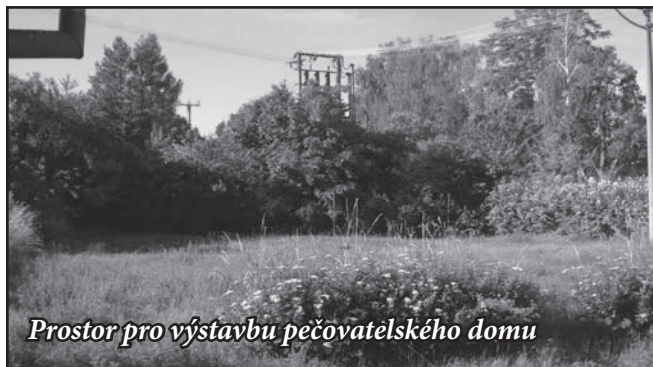
Prostor pro výstavbu pečovatelského domu